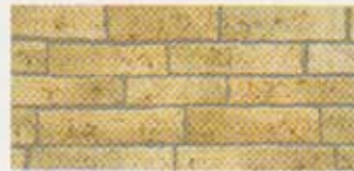
●ラスティーホワイトKM (080-07)