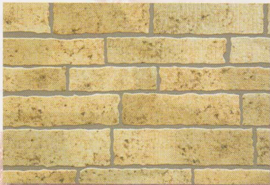
●ラスティーホワイトKM (080-07)