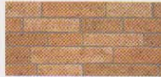
●ラスティーブラウンKM (080-06)